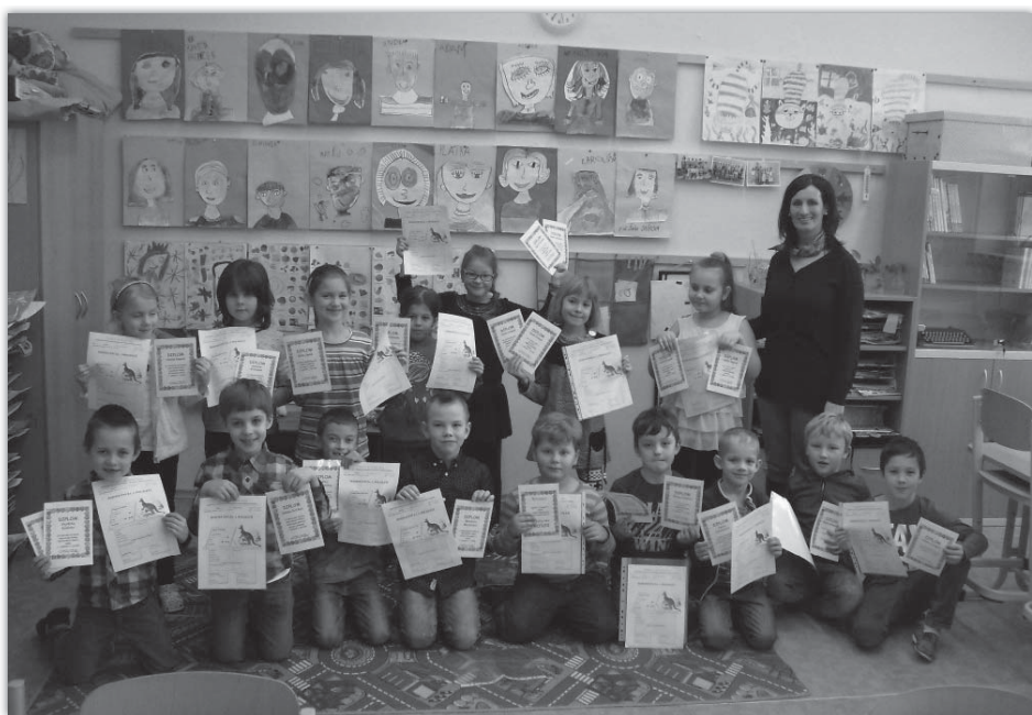
Pololetní vysvědčení - 1. třída