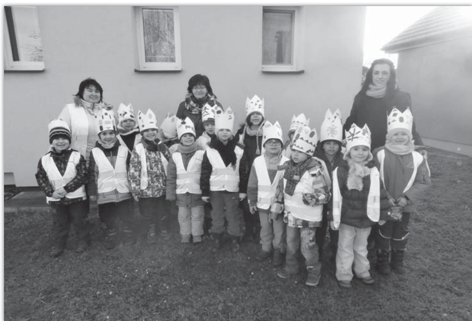
Tři králové - třída Včelíček