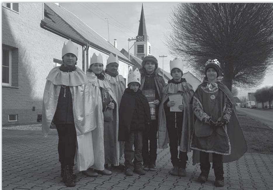
Tříkrálová sbírka 2018