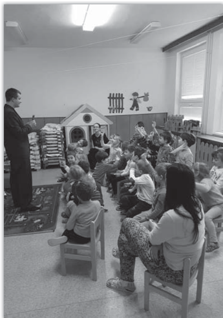
Beseda s myslivcem