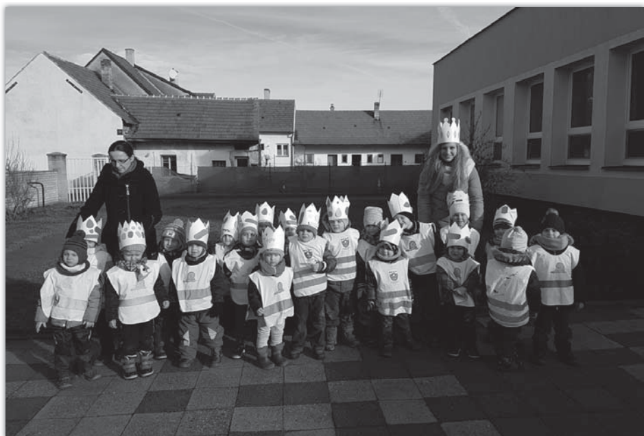
Tři králové - třída Berušek