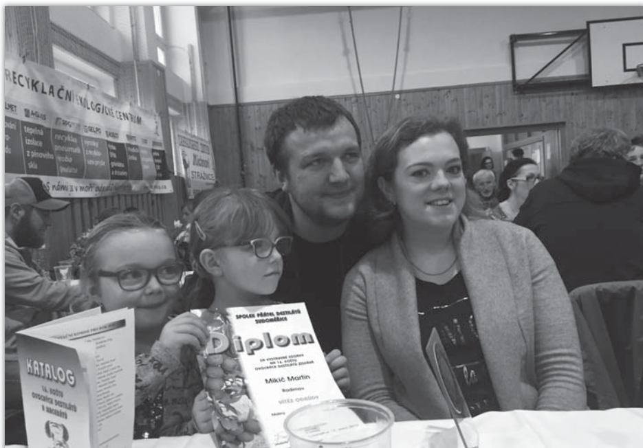
Košť ovocných destilátů a macerátů – 17. únor 2018