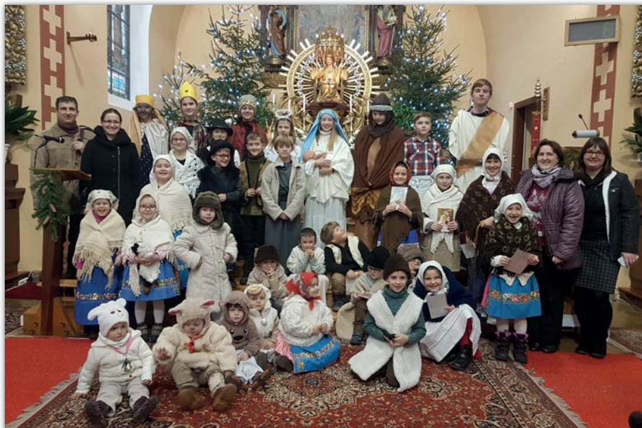
Vánoční pásmo v kostele – 25. 12. 2017