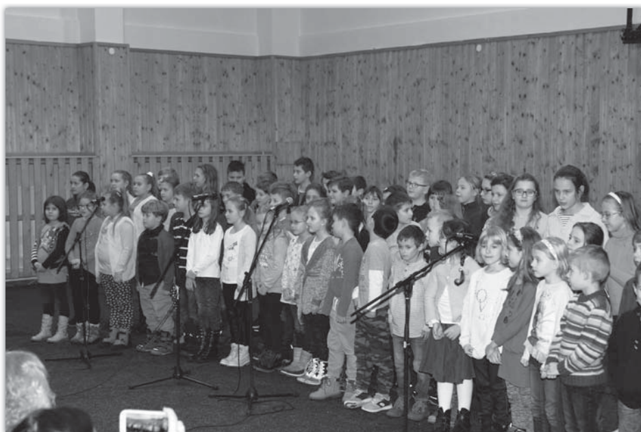
Zpívání u stromečku - 21. 12. 2017