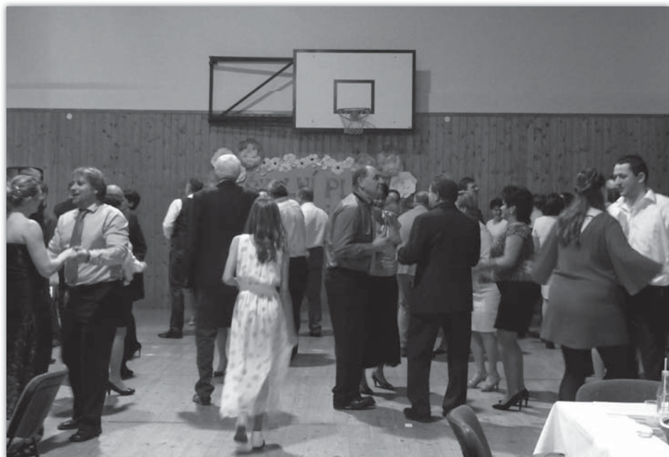
Školní ples - 2018