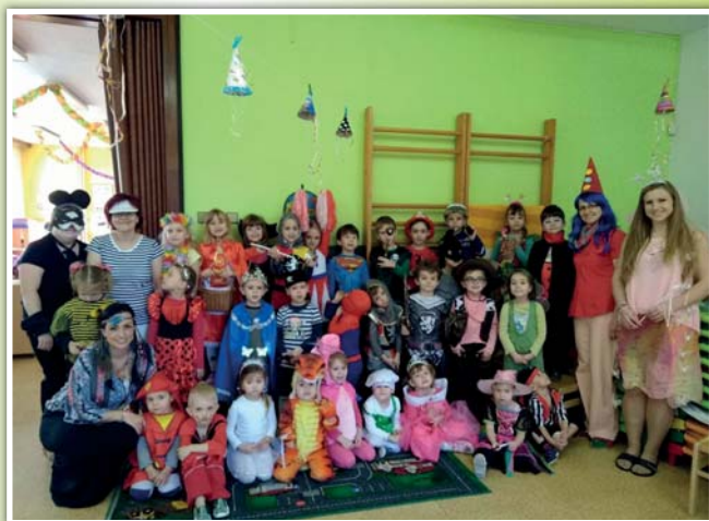
Karneval MŠ 2018