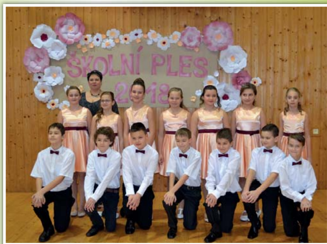
Školní ples 2018

Největší co do objemu je stavba „Přístavba tělocvičny základní školy Sudoměřice“, která bude stát okolo 12 mil. Kč.