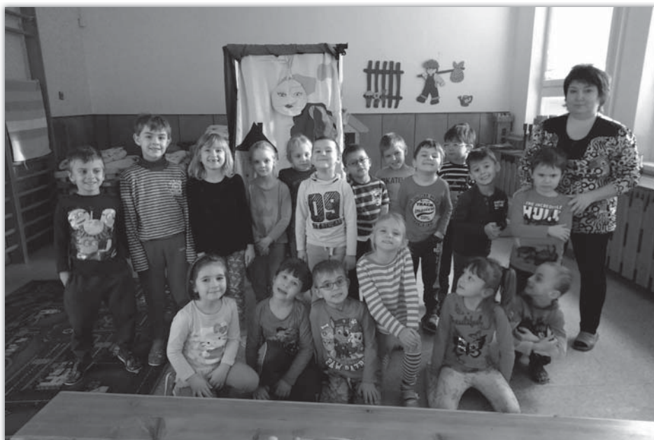
Divadlo - Pohádky od Lenky - Včeličky