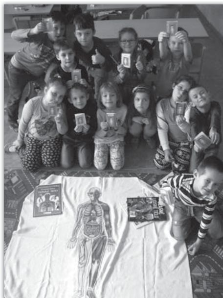
Pokusy, lidské tělo - 1. ročník (3. místo).