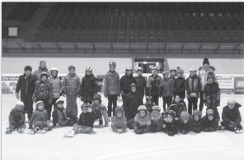
Bruslení 3., 4., a 5. ročníku na zimním stadionu TEZA Hodonín – 15. 2. 2018