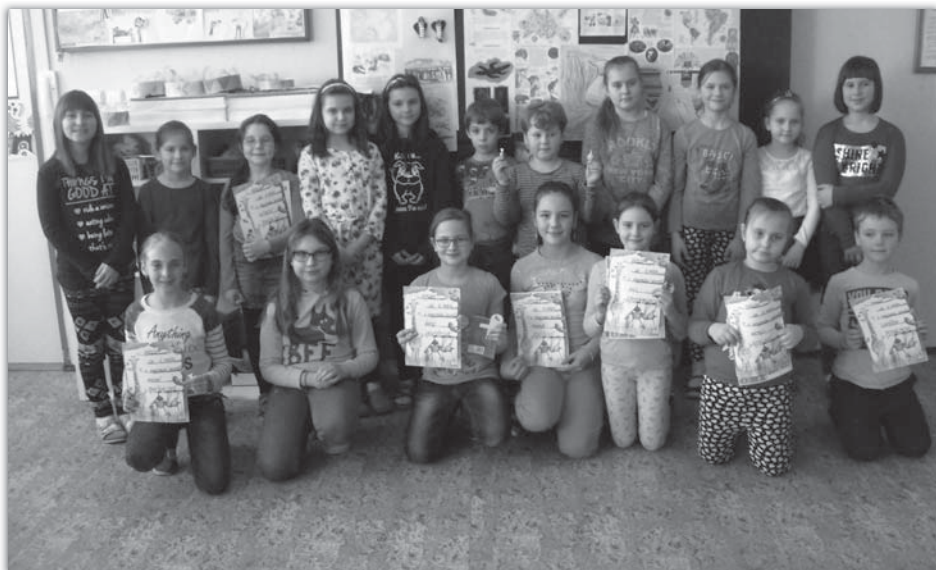
Účastníci recitační soutěže – 22. února