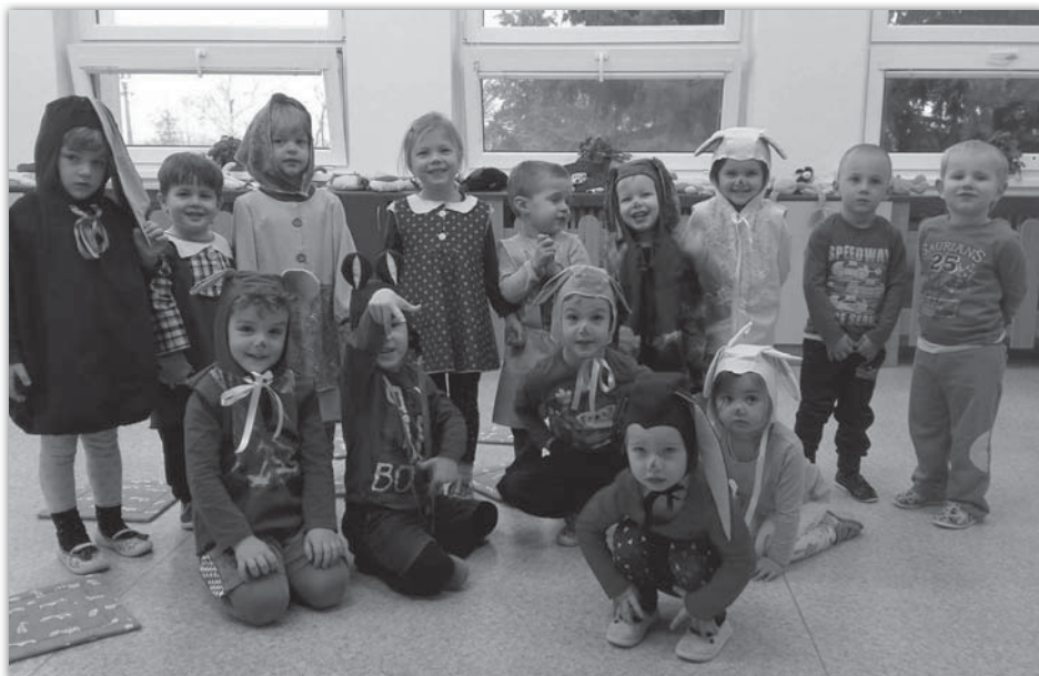
Pohádka O Řepě - Berušky

Základní škola a Mateřská škola Sudoměřice, okres Hodonín, příspěvková organizace