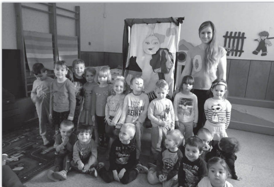
Divadlo - Pohádky od Lenky - Berušky