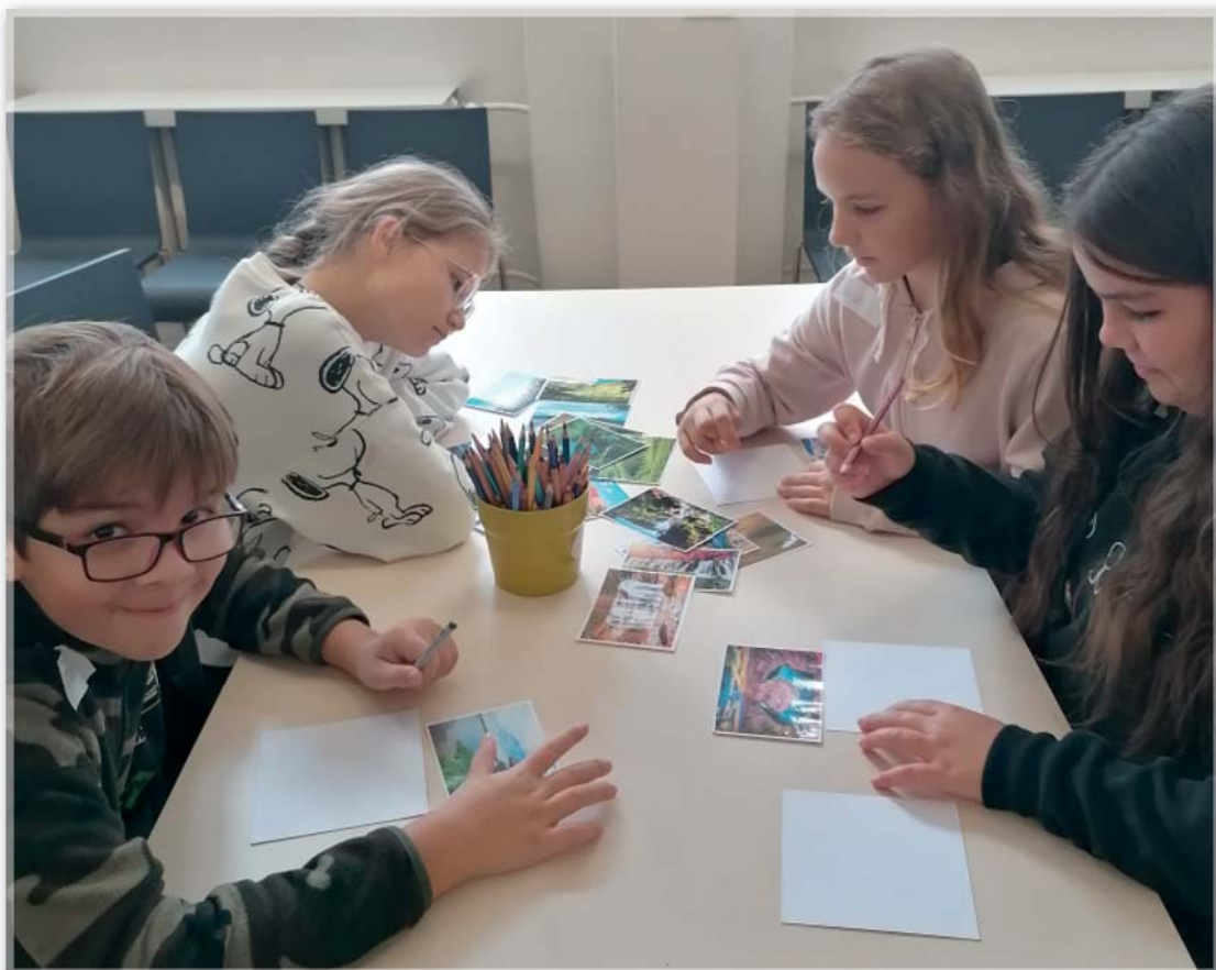
Žáci 5. třídy na návštěvě v galerii