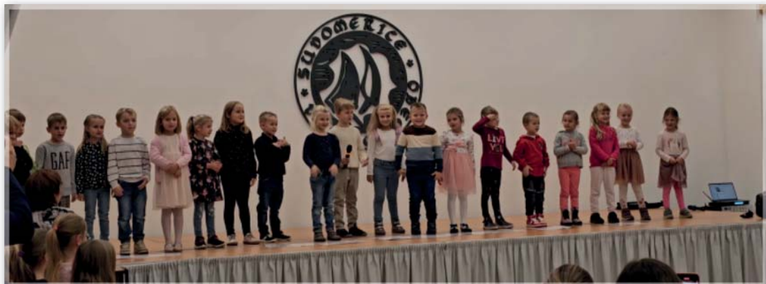
Oslava 100. výročí založení Místní knihovny