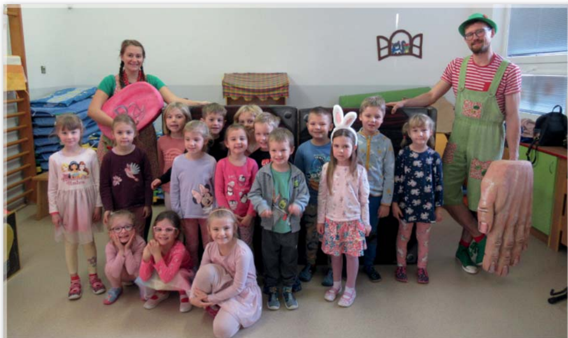
Divadlo z truhlice