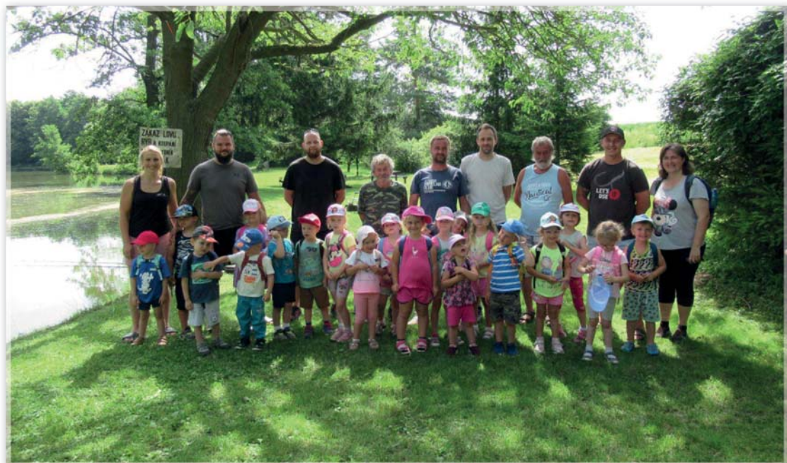
Mateřská škola a rybáři