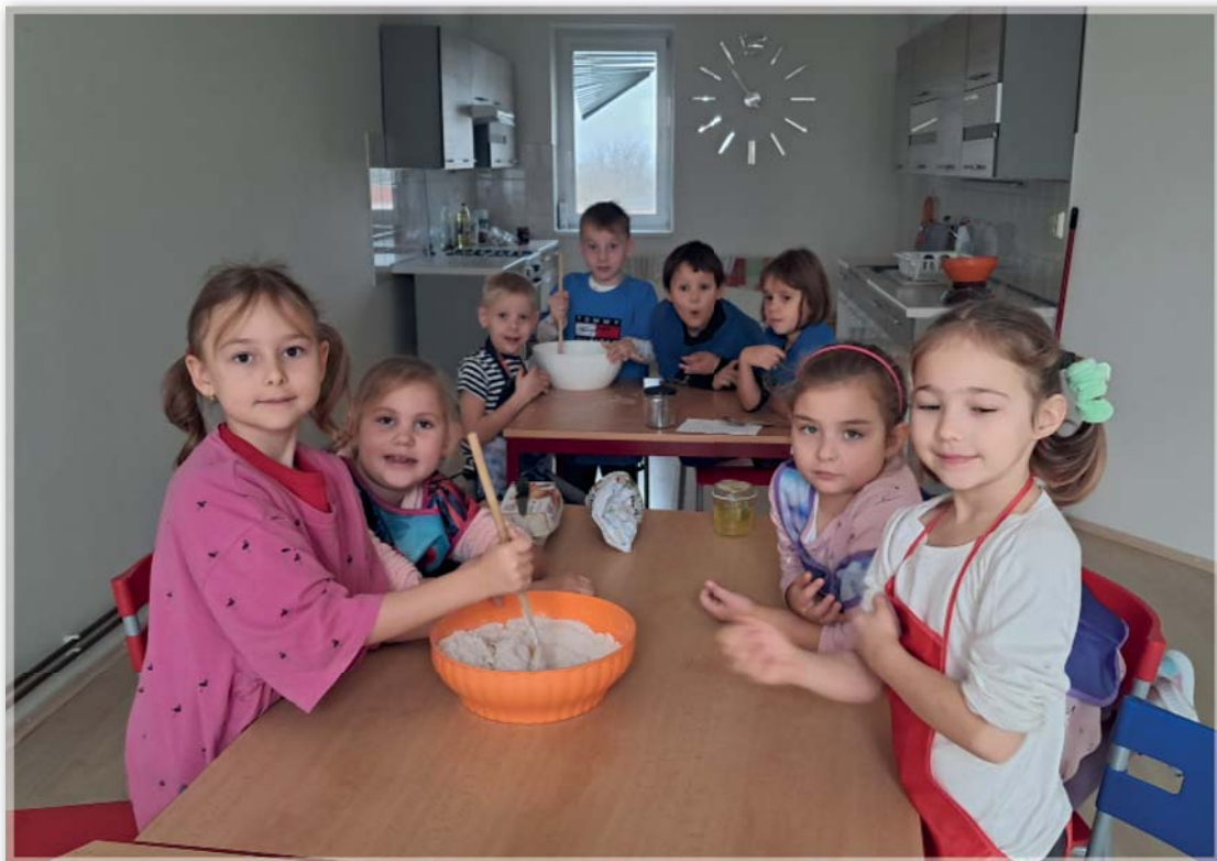
Pečení perníčků – 1. třída