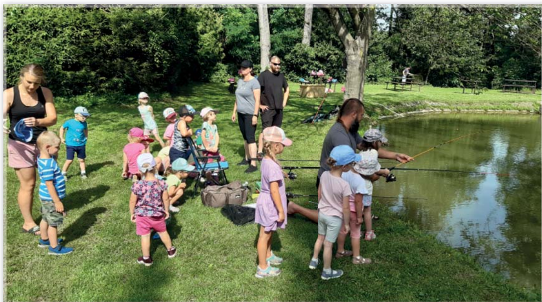
Mateřská škola – děti zkoušejí rybařit