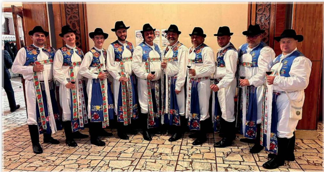
Sudoměřičtí mužáci ve Skalici