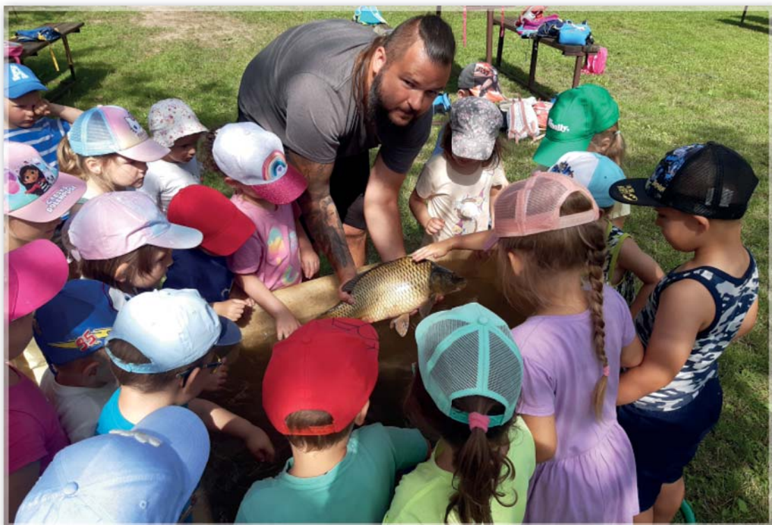
Mateřská škola – děti obdivují úlovky