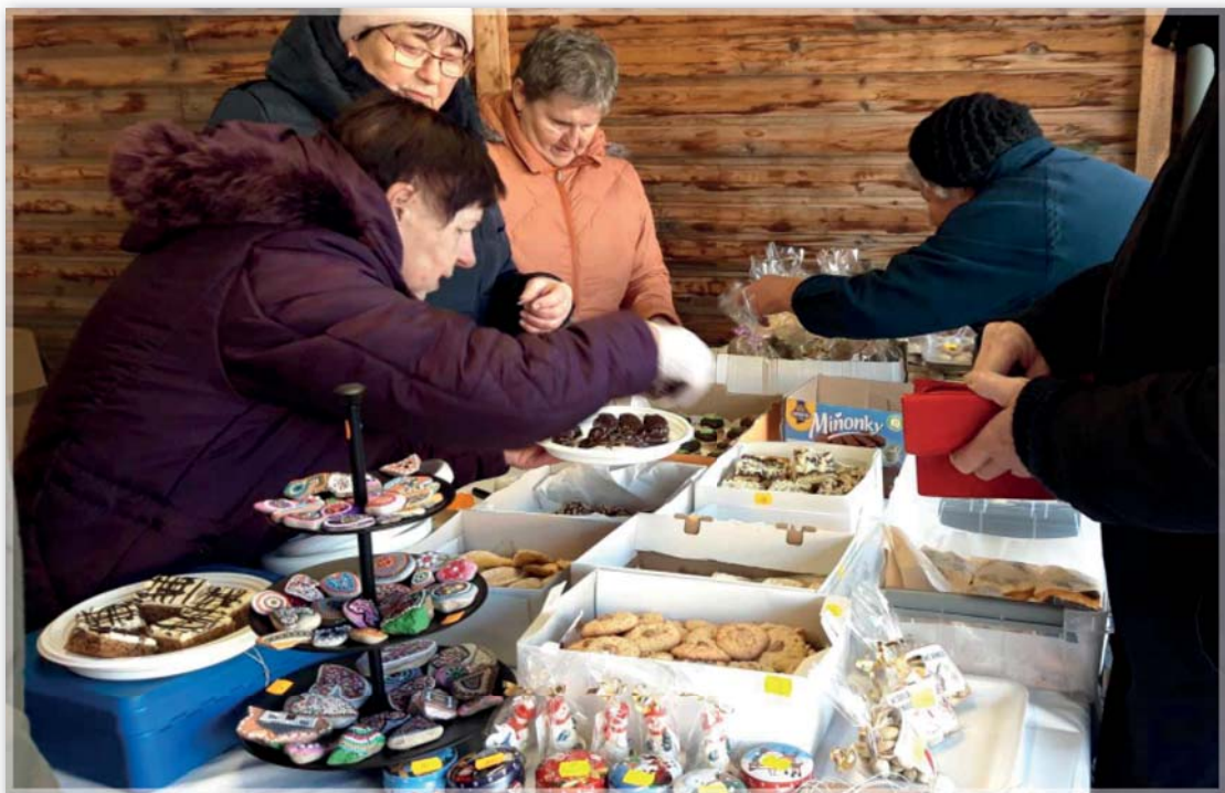
Členky spolku seniorů na vánočním jarmarku 30. 11. 2024