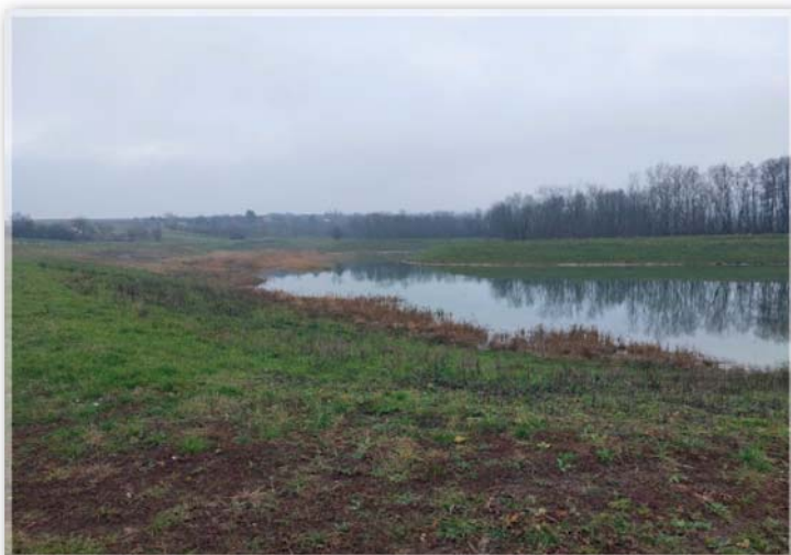
Vodní nádrž Telatniska

částečná protipovodňová funkce a současně vznikl biotop, který přírodě v okolí naší obce jenom pomůže. Nyní se intenzivně řeší převod celého díla do majetku Obce Sudoměřice.