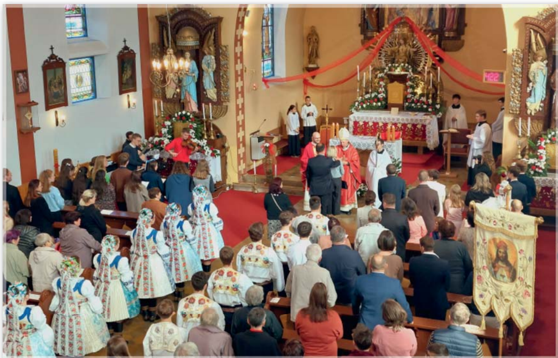
Udílání svátosti biřmování