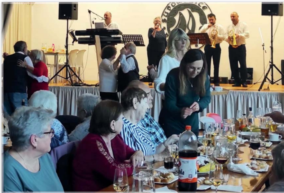
Posezení se seniory – 1. 10. 2024