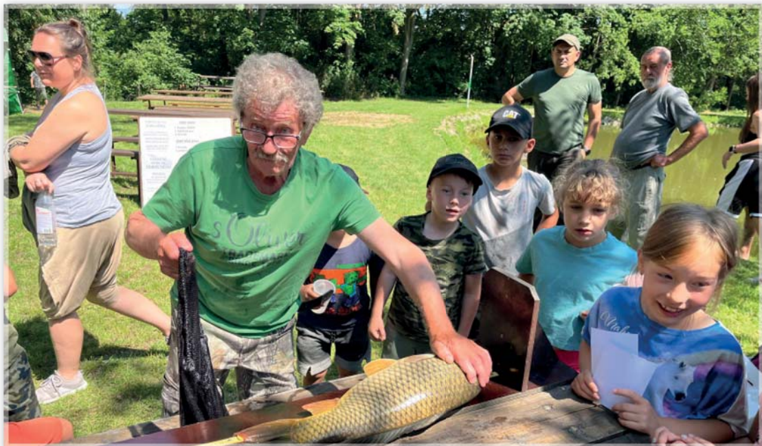
Dětské rybářské závody – úlovky