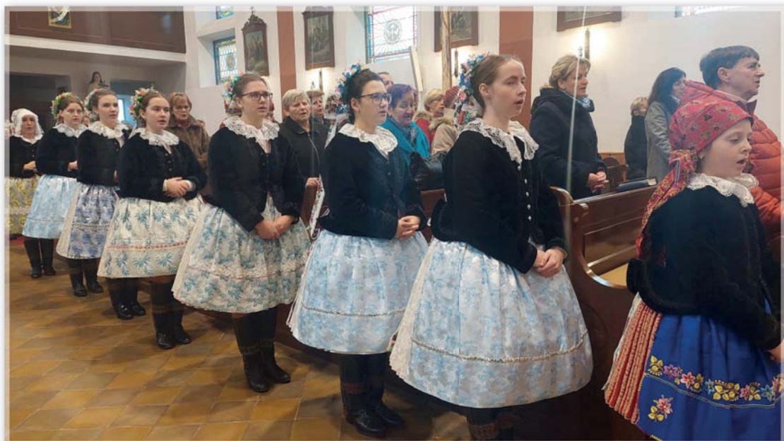
Slavnost Krista Krále 24. listopadu 2024