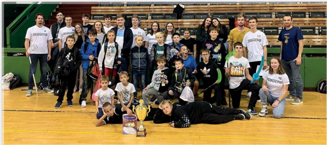
Florbalový turnaj v Olomouci 28. září 2024