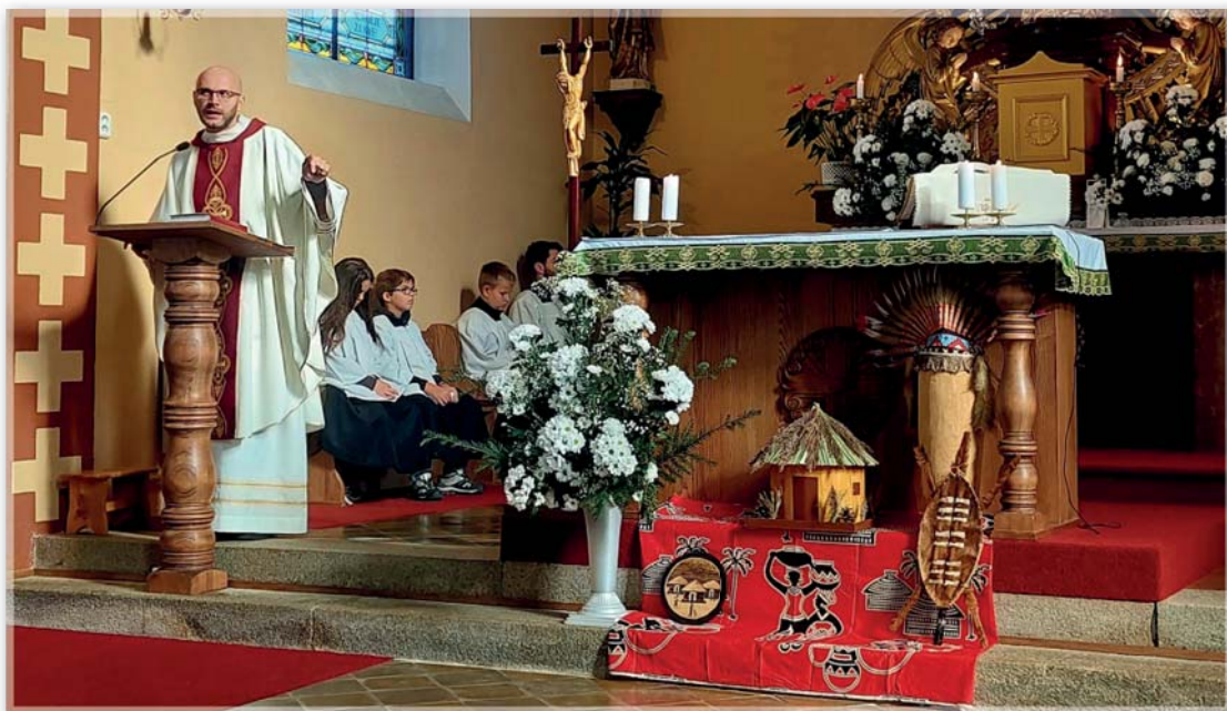
Misijní neděle 20.října 2024