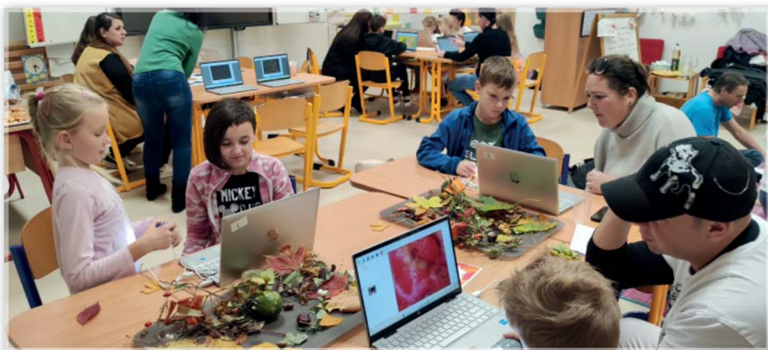
Setkání s rodiči