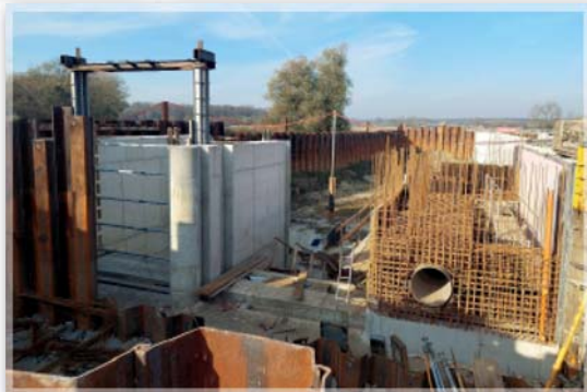
Stavba plavební komory na Baťově kanálu