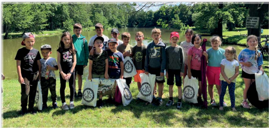
Dětské rybářské závody – závodníci