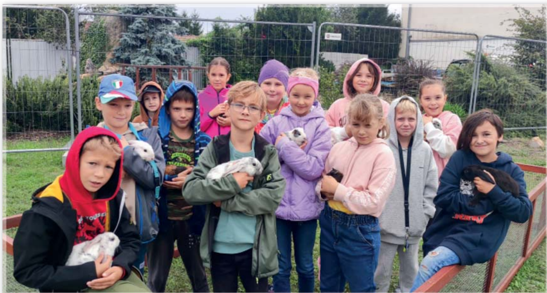
Žáci 3. třídy na chovatelské výstavě