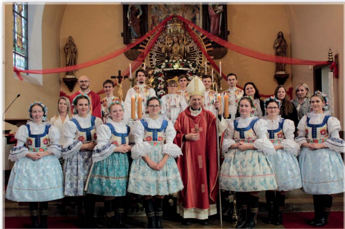
Společné foto biřmovanců s Mons. Antonínem Baslerem